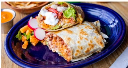
ブリトーとタコス

私の故郷はカリフォルニア州のサンフランシスコ・ベイエリアです。私の出身地にはおいしい食べ物がたくさんあります。皆さんに私の大好物をいくつか紹介しましょう。