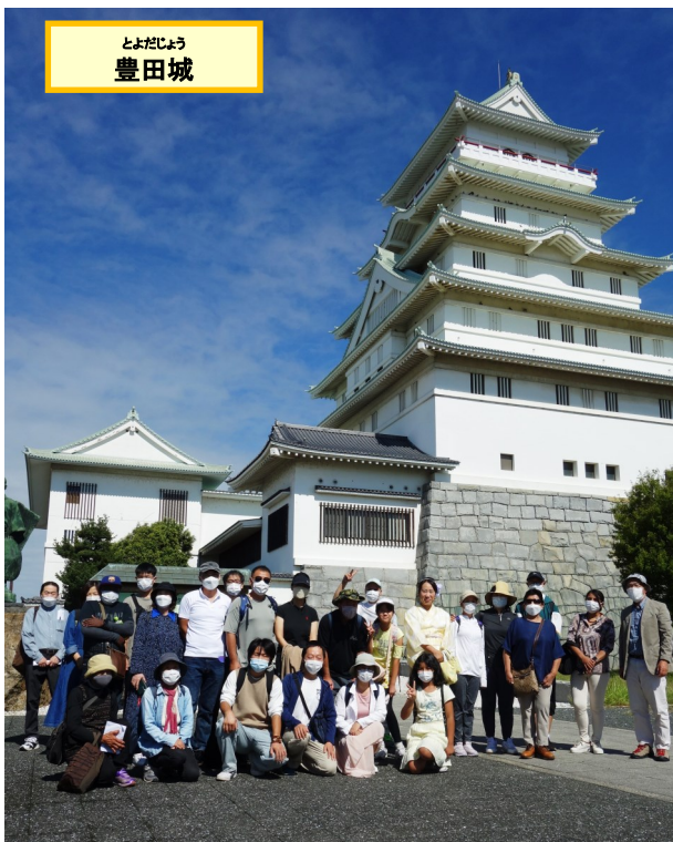
とよだじょう 豊田城

今回のバスツアーは、一昨年から新型コロナウイルスの感染拡大が続き、この間感染予防の観点から実施できませんでしたので、参加者の方々から、「久しぶりのピクニックのような感じで大変楽しめました」などの声が寄せられました。(交流部 鈴木 隆)