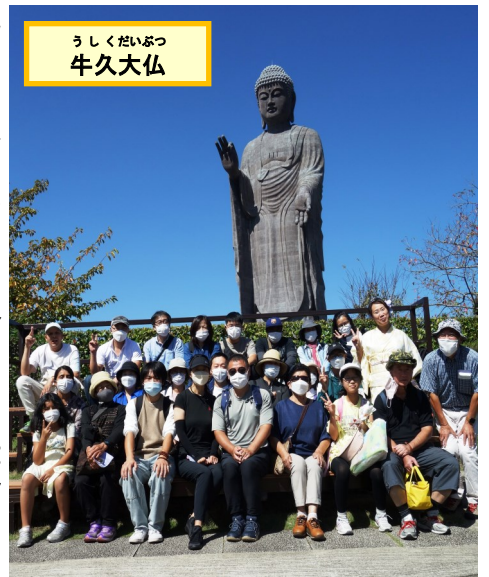
うしくだいぶつ 牛久大仏

がら何度か見えてきました。園内に入ったのは初めてで、ギネス級の120mの高さの仏像に圧倒される思いでした。夕方4時30分頃予定通り市役所へ帰り解散となりました。日本文化の新たな発見と、思い出の一つになるツアーとなりました。