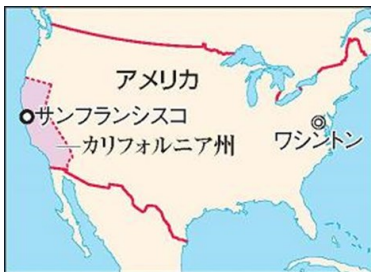
カリフォルニア州サンフランシスコ

食べたことがない料理を食べるのが大好きです！目新しいレストランも大好きです。日本に来てから・寿司・天ぷら・お好み焼き・その他の日本食をたくさん食べてきました。