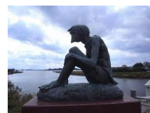
うしくぬま 牛久沼のカッパ

コロナ禍も徐々にではありますが、収まりつつあります。TIFA会員の皆様はコロナのために運動不足になっていませんか。ウォーキングで美しい紅葉の秋を満喫しましょう。