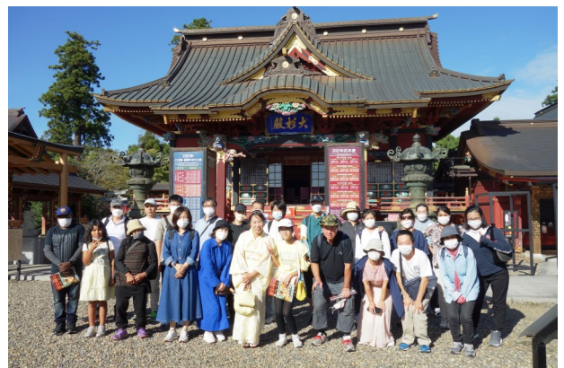
おおすぎじんじや 大杉神社