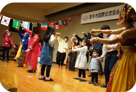
舞台上がって皆でバリダンス