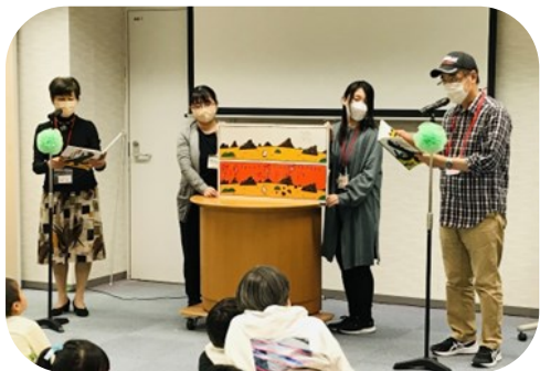
おまえうまそうだな(中国語)

また、それぞれの国の言葉で「こんにちは」と皆で挨拶、一気に打ち解けたオープニングとなりました。