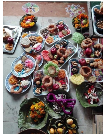
ダサイン(国の祭り)で 食べるごちそう

ネパールの国旗は、2つの 三角形を重ねた形で、世界 で唯一四角形ではない国旗 です。国旗の中の2つの白 いシンボルは、上が月、下 は太陽を表します。