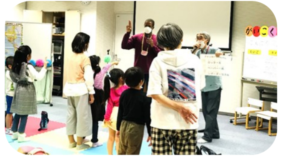
アメリカのじゃんけん

そのま ごうれい 恒例 たいかい のじゃんけん大会 とつにゆう に突入 こんかい 。今回は4 こくすべ ヶ国 たいかい 全てのじゃんけん大会 おおも ということで、大いに盛り上 あ がりました。賞品 しょうひん を手に、嬉 うれ しそうに帰 かえ っていく子ども達 こ の後ろ姿 たち を見て、出演者全員 うし が幸 すがた せ一杯 み でした。 しゅつえんしゃぜんいん (日本語教室部 福元 満子)