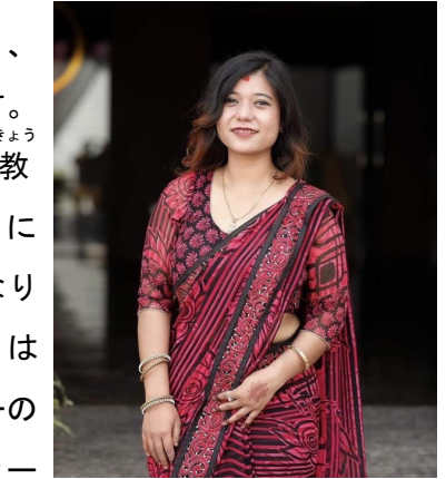
ネパール民族衣装の筆者