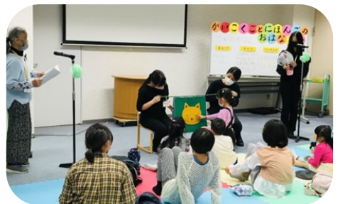
おはよう おやすみ(ベトナム語)