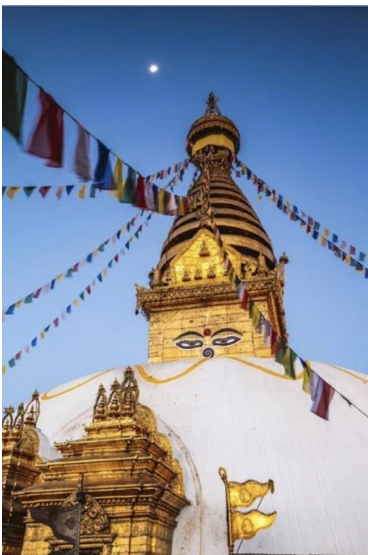
世界遺産スワヤンブナート

その山々に囲まれた首都カトマンズのある「カト マンズ盆地」は、歴史的な宮殿・寺院・史跡があ